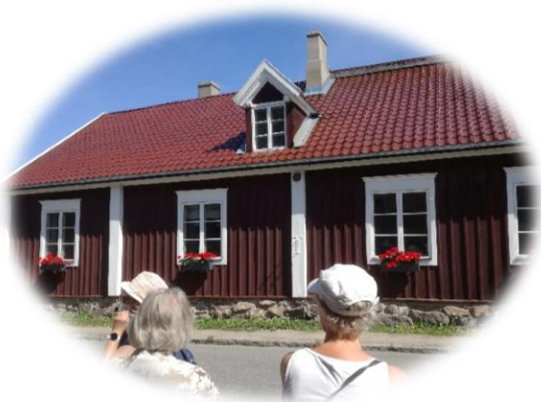
Bild 2. Rahmska gården