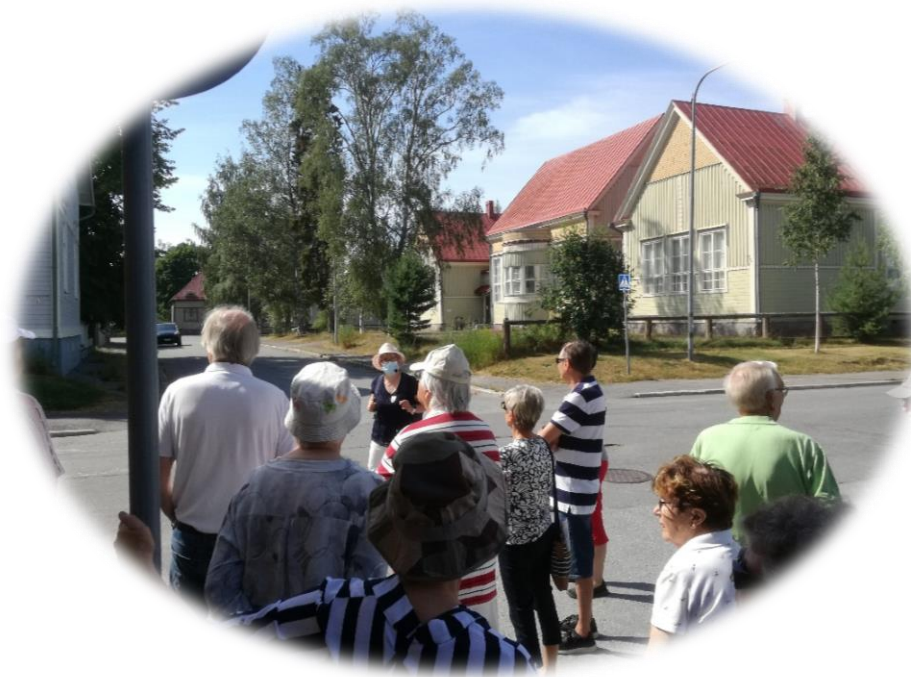
Bild 5. Renlunds folkskola