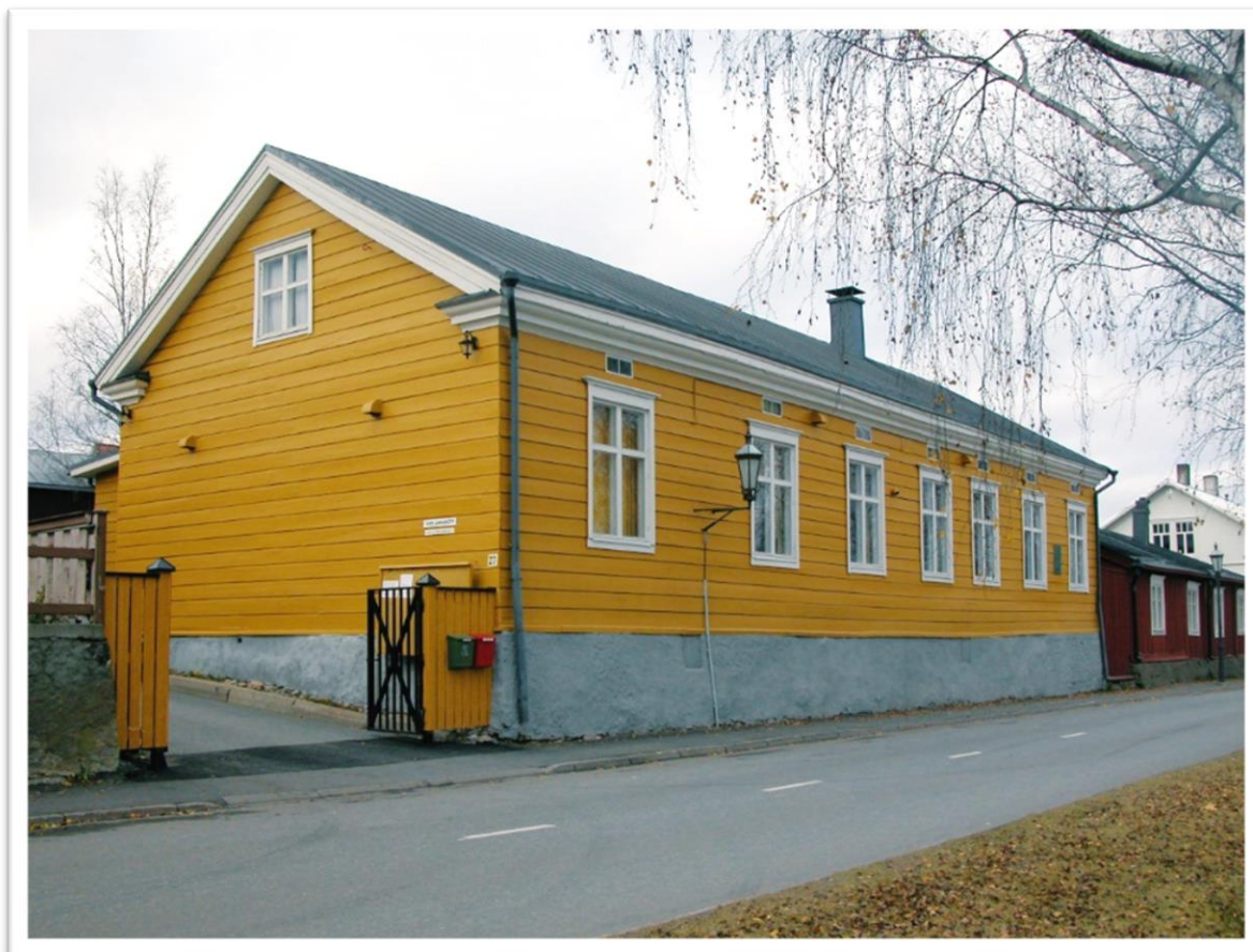
Bild 9. Snellmans gården