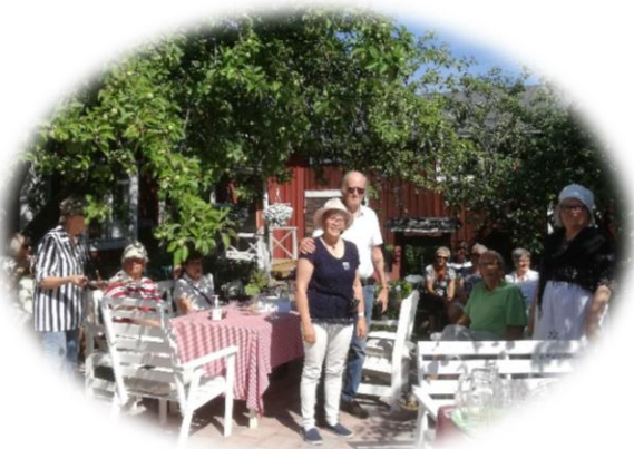
Bild 4. Saftpaus