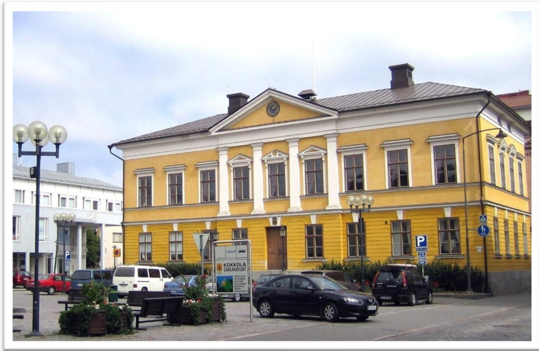
Bild 7. Rådhuset